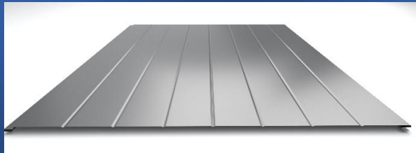
RO - rowek