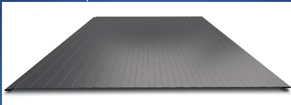
P25 - mikrotrapez