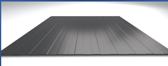
LA - liniówka